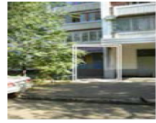
Рис. 4. Месторасположение парикмахерской

Собственнику желательно создать поток посетителей хотя бы 150 человек в неделю. Ассигнования, выделенные собственником на продвижение парикмахерской – не более 100 000 рублей. На той же улице четыре месяца назад открылась парикмахерская-конкурент на 4 посадочных места. Никаких услуг, кроме стрижки, не оказывают. Помещение крохотное, люди ждут своей очереди прямо в салоне. Работают 18-летние гастарбайтеры из Молдовы и Украины.